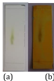
Gambar 4.3 Profil Kromotografi Lapis Tipis Fraksi N-heksan Daun Lengkuas ( Alpinia Galanga ) Uji Alkaloid (a) Sinar Tampak sebelum penyemprotan (b) Sesudah Penyemprotan Pereaksi Dragendroff . Hasil uji alkaloid dengan eluen Metanol:ammonium (5 : 0,25) positif mengandung senyawa alkaloid.

Pengujian Kualitatif Identifikasi Senyawa Secara KLT